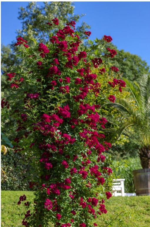
'Perennial Domino'