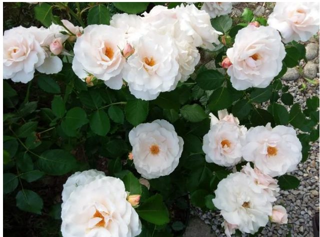
'Queen of Warsaw'