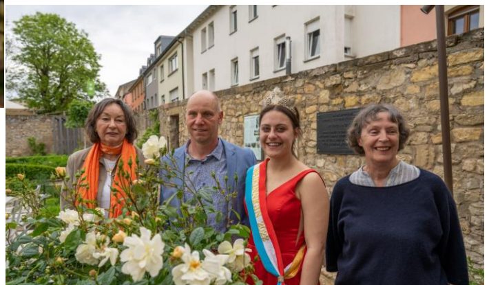
Doop van 'Machera' op 12 mei 2023.

'Machera' is een elegante Moschata hybride die bloeit met zeer grote trossen. De bloemknoppen en bloemen zijn eerst lichtabrikoos of ambergeel en verkleuren vlug naar roomwit. De middelgrote bloemen zijn gevuld en openen zich als platte kommen waarin de amberkleurige meeldraden opvallen. De rechtop groeiende struik kan tot 150 cm hoog groeien. Tijdens de zomer is de bloei bleker dan tijdens de herfst; dan zijn de kleuren